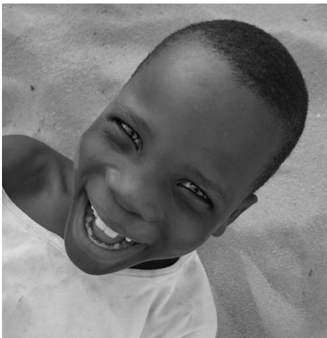
un enfant de Tohoué (Bénin)

Depuis 2007, l'association Volodalen agit à Tohoué, un petit village du Bénin situé à 5 km de la frontière avec le Nigéria.