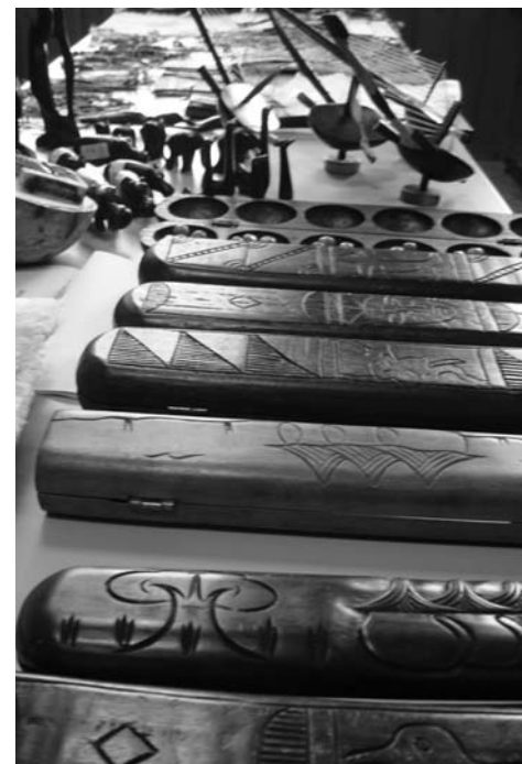
Vente solidaire à Chavéria