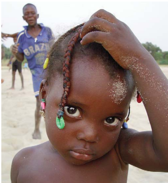
un enfant de Tohoué (Bénin)

Depuis 3 ans, l'association Volodalen agit à Tohoué, un petit village situé au sud du Bénin.